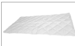
Flamskyddad bäddmadrass FÖR ÖKAD KOMFORT – ett komplement som inte minskar brandsäkerheten.