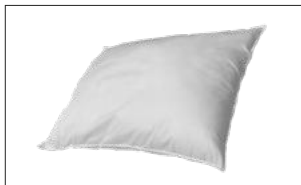
Flamskyddad kudde ERBJUDER GOD KOMFORT