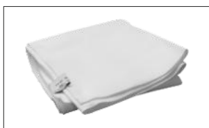
Flamskyddad filt VARM & SKÖN. Svår att riva sönder på både kort- och långsida.