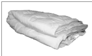
Flamskyddat täcke HÖG KOMFORT OCH GOD ANDNINGSFÖRMÅGA