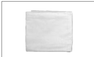
Flamskyddat örngott FRÄSCHT OCH HYGIENISKT