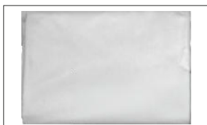
Flamskyddat lakan* ENKEL RENGÖRING – torkar snabbt och bibehåller sin form efter tvätt.