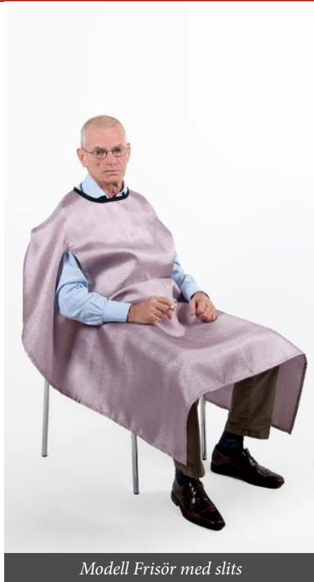
Modell Frisör med slits